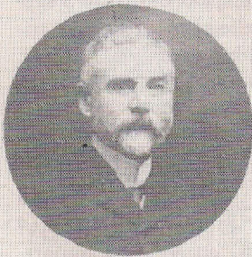
BID VOOR DE ZIEL VAN MIJNHEER