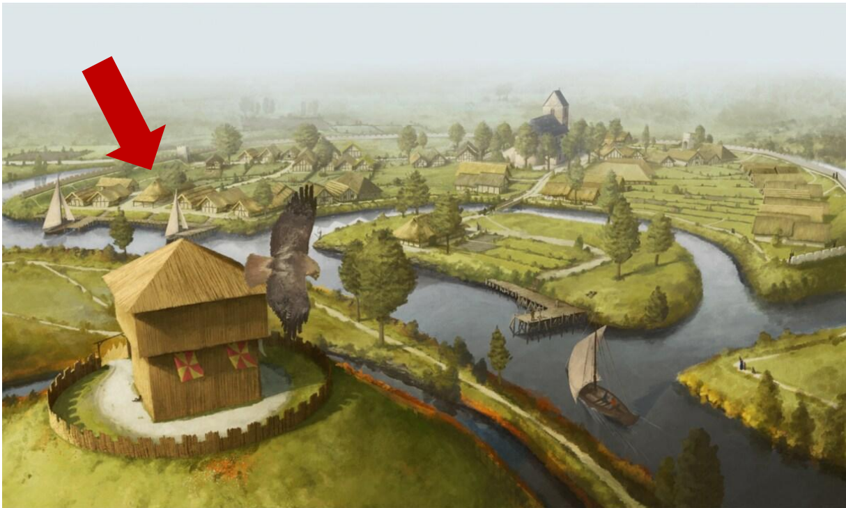
Reconstructie van Aalst ten tijde van de slag van Hertshage. Yannick De Smet. (zonder huizen te zien vanop het Werfplein)

Rollen: Willem Clito (1 persoon), Diederik van de Elzas (1 persoon), verteller (1 persoon), Fransgezinde soldaten, Vlaamse stedelijke soldaten.