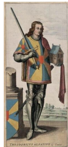
Diederik van de Elzas

Pak allemaal een personenkaartje uit de enveloppe. Bekijk je kaartje, gebruik volgende richtvragen om te beslissen wie jij binnen je rol zal steunen om de nieuwe graaf van Vlaanderen te worden.